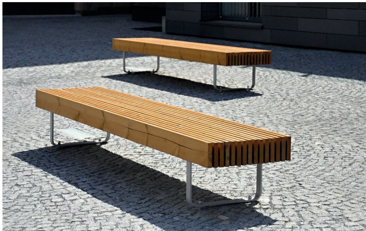
Cette image est illustrative et peut ne pas exactement reproduire le produit décrit.